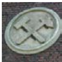
Mining in Society