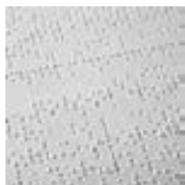
Signs, Signals, and